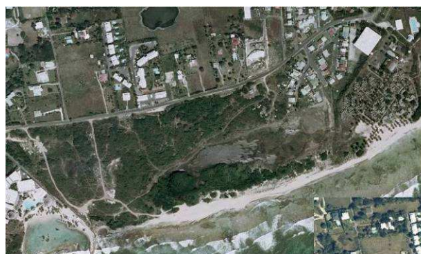
Orthophoto IGN 2004

Le besoin de protection se fait d'autant plus ressentir que l'on constate entre les deux dernières orthophotos que l'espace naturel a été réduit à l'Ouest et à l'Est. Simultanément, il semble que la végétation sur site s'est densifiée.