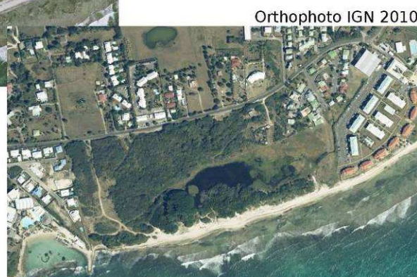
Orthophoto IGN 2010