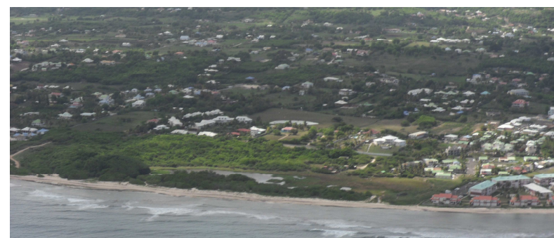
Vues aériennes obliques sur le site